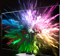
TV Neo QLED